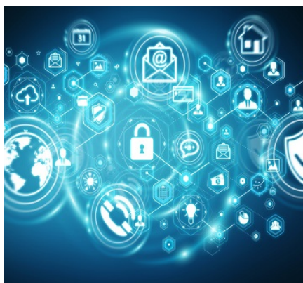
PROTECCIÓN DE DATOS