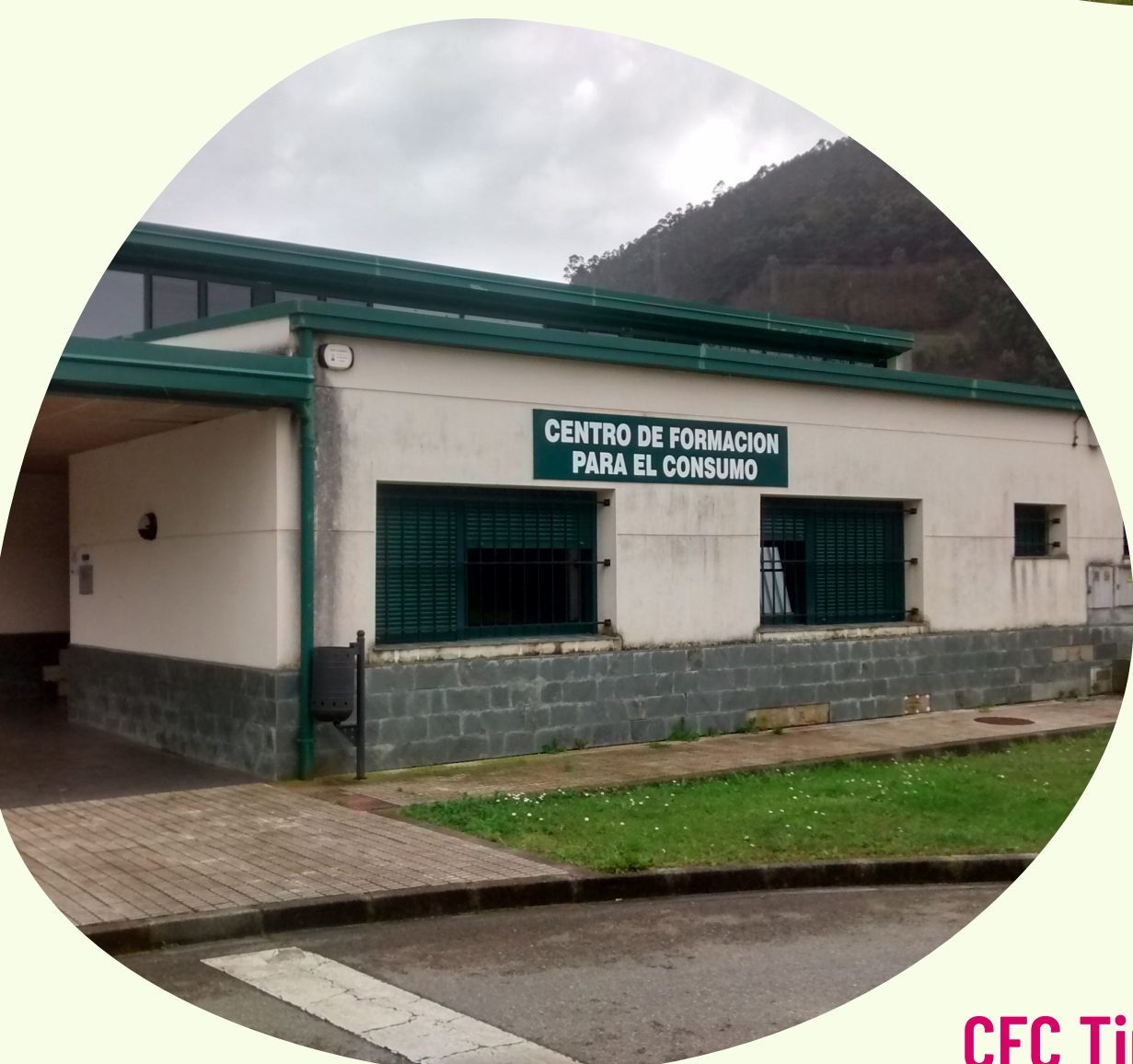
CFC Tineo 985 800 558