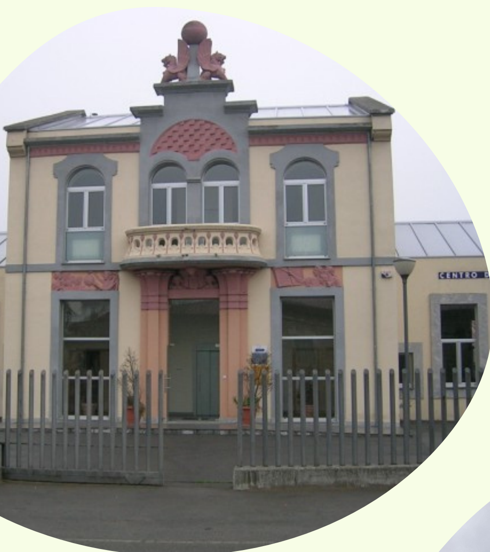
CFC Lugones 985 268 468