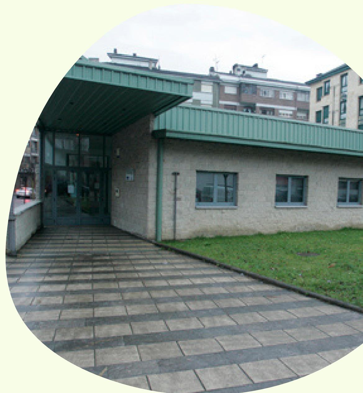
CFC Blimea 985 672 596