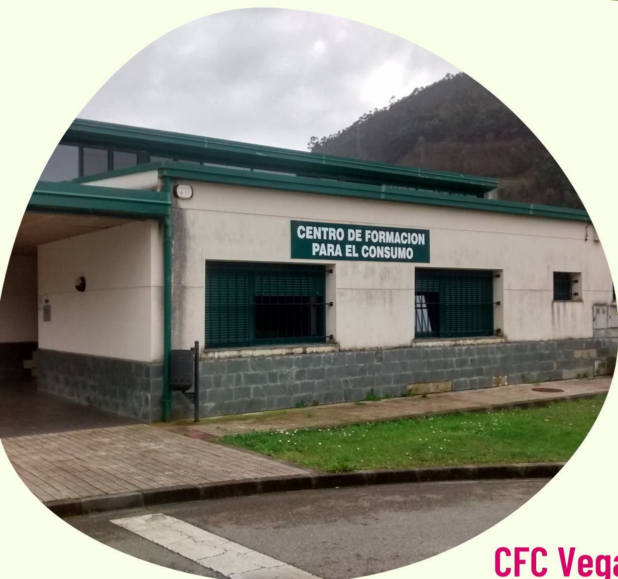
CFC Vegadeo 985 634 539