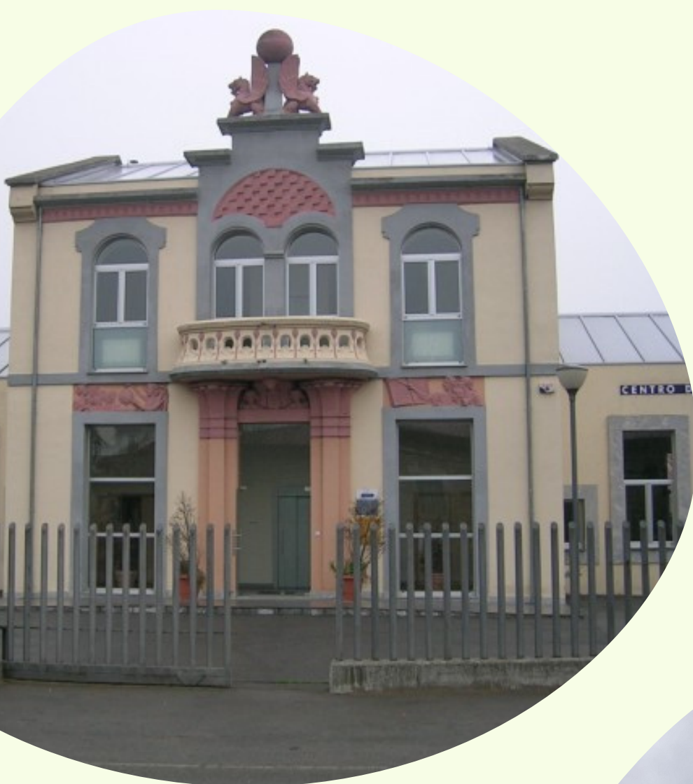
CFC Lugones 985 268 468