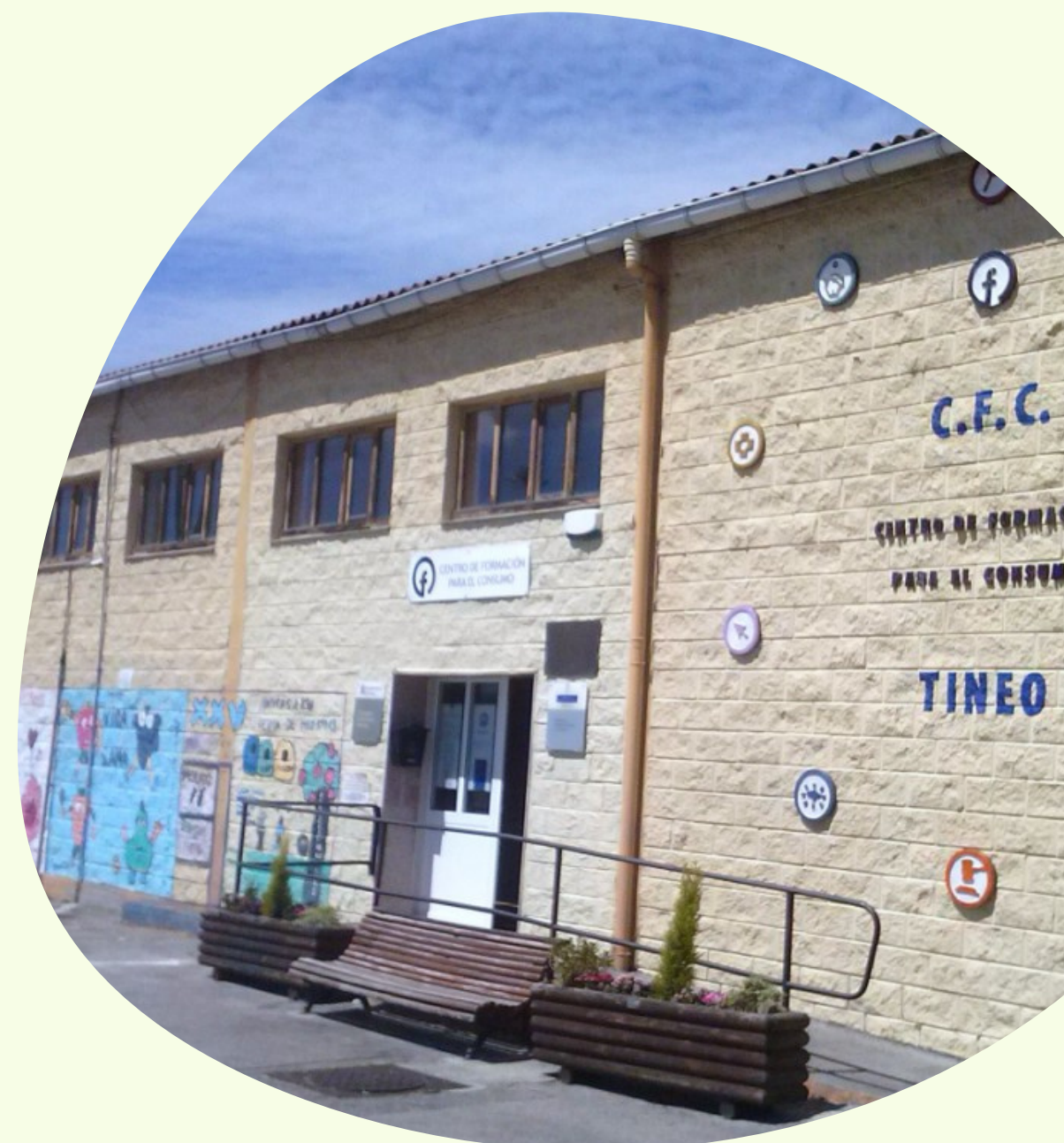
CFC Tineo 985 800 558