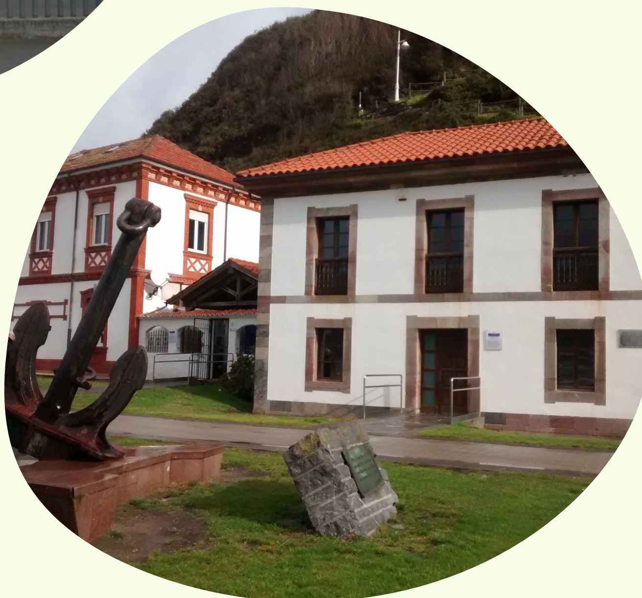
CFC Ribadesella 985 928 194 684 605 302